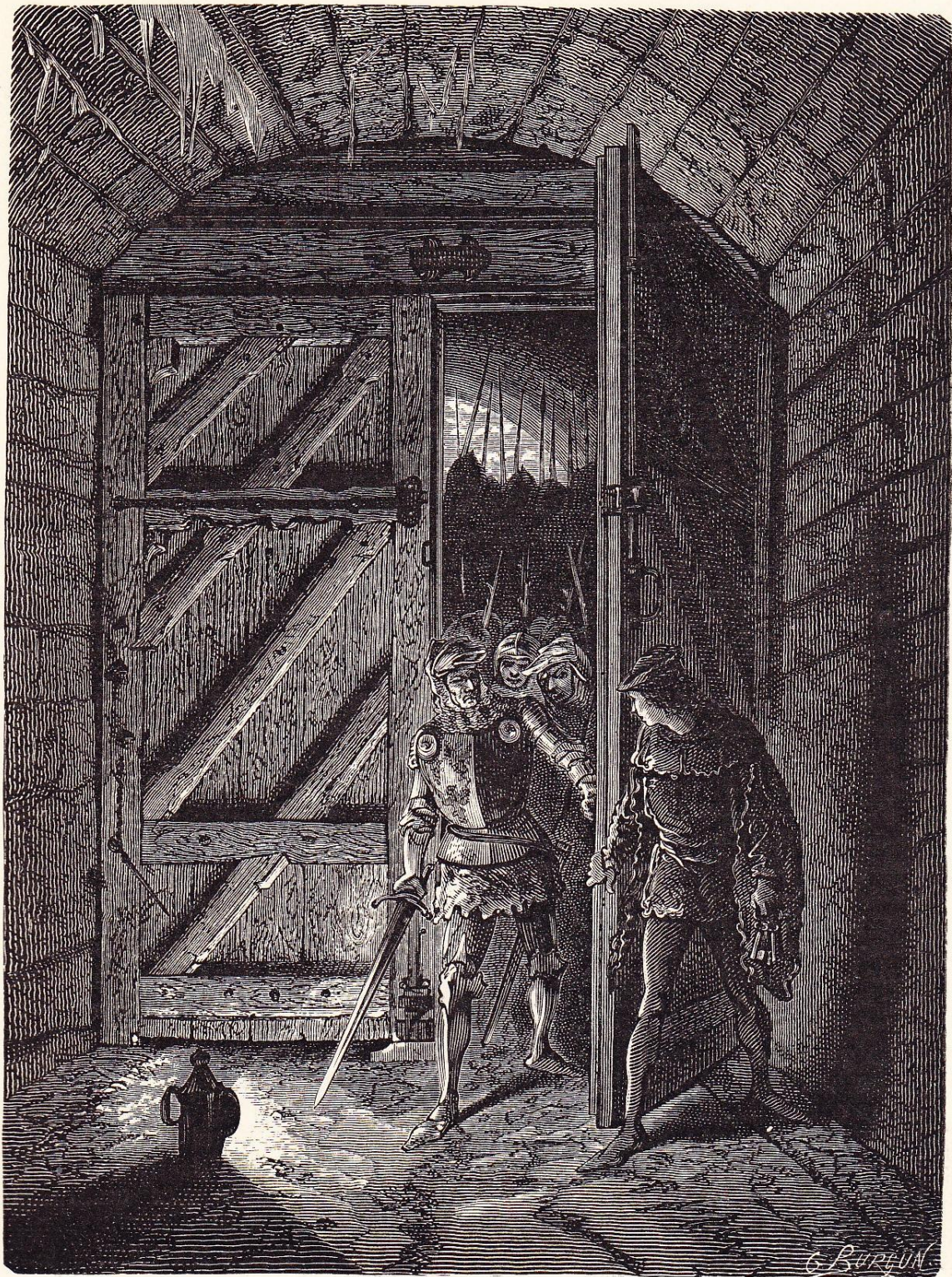
Perrinet Leclerc ouvrant la porte de Buci aux Bourguignons (1418).