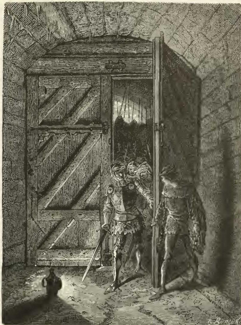
Perrinet Leclerc ouvrant, de nuit, la porte de Bucy aux Bourguignons.

comprimé à Rouen, et Paris, trop bien surveillé, ne put se soulever (août-septembre 1417).